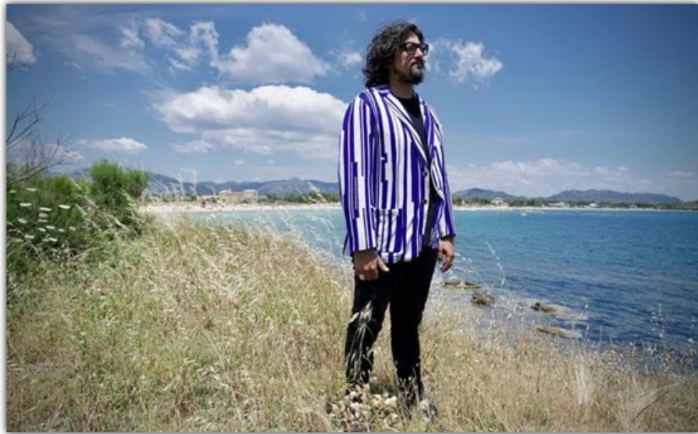
Alessandro Borghese immortalato in Sardegna

Il van di Alessandro Borghese sbarca nell'Isola, e la puntata ambientata in Sardegna della trasmissione tv condotta dal celebre chef. "Quattro quattro realtà del territorio, impegnate a guadagnarsi il titolo di miglior ristorante da vacanza del sud della Sardegna. In corsa per la vittoria Lido Tamatete di Castiadas, La Paillotte di Calafighera, Agriturismo La Biada di Santa Margherita di Pula e Ittiturismo Sabor' e mari di Porto Budello.